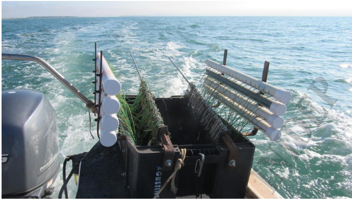
Figura 2. Sistema de calado rápido de anzuelos, utilizado para la marcación de gatuza.