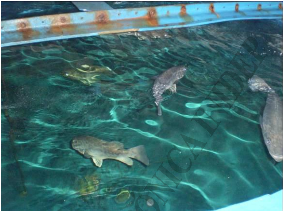
Figura 2: Ejemplares de chernia capturados en tanque redondo de 14,2 m 3 de capacidad en aclimatación.