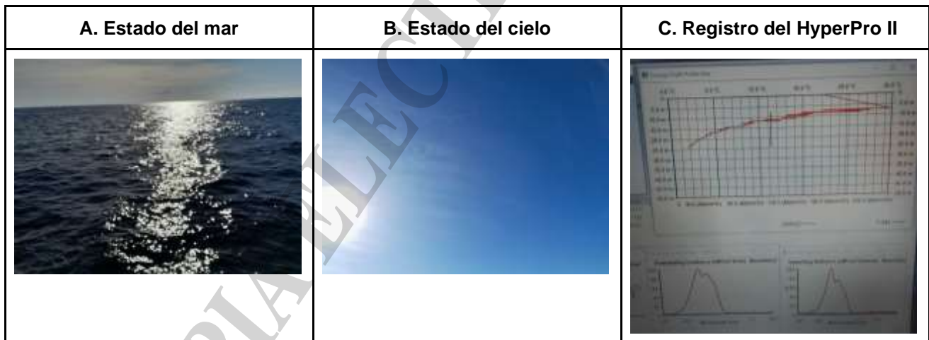
Figura 4: Imágenes del estado del mar (A) y el cielo (B) al momento de utilizar el HyperPro II durante el descenso (C).