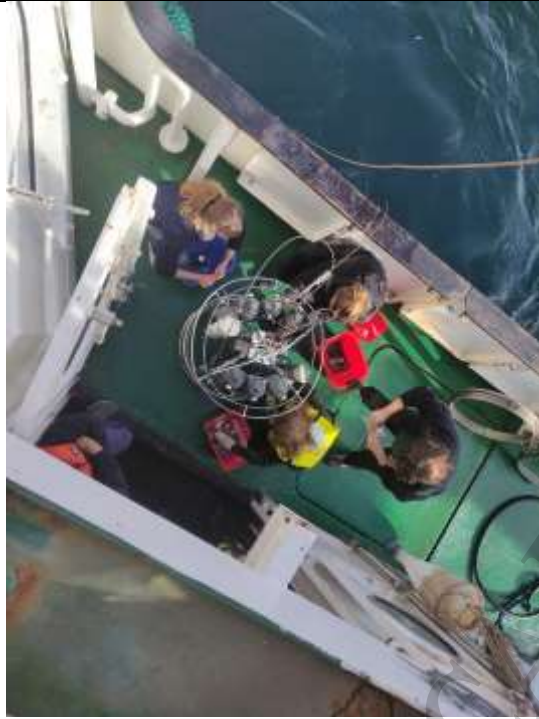
Figura 6. Recolección de agua de mar a distintas profundidades desde botellas Niskin.

El agua colectada se utilizó para las determinaciones detalladas a continuación (Figura 6):