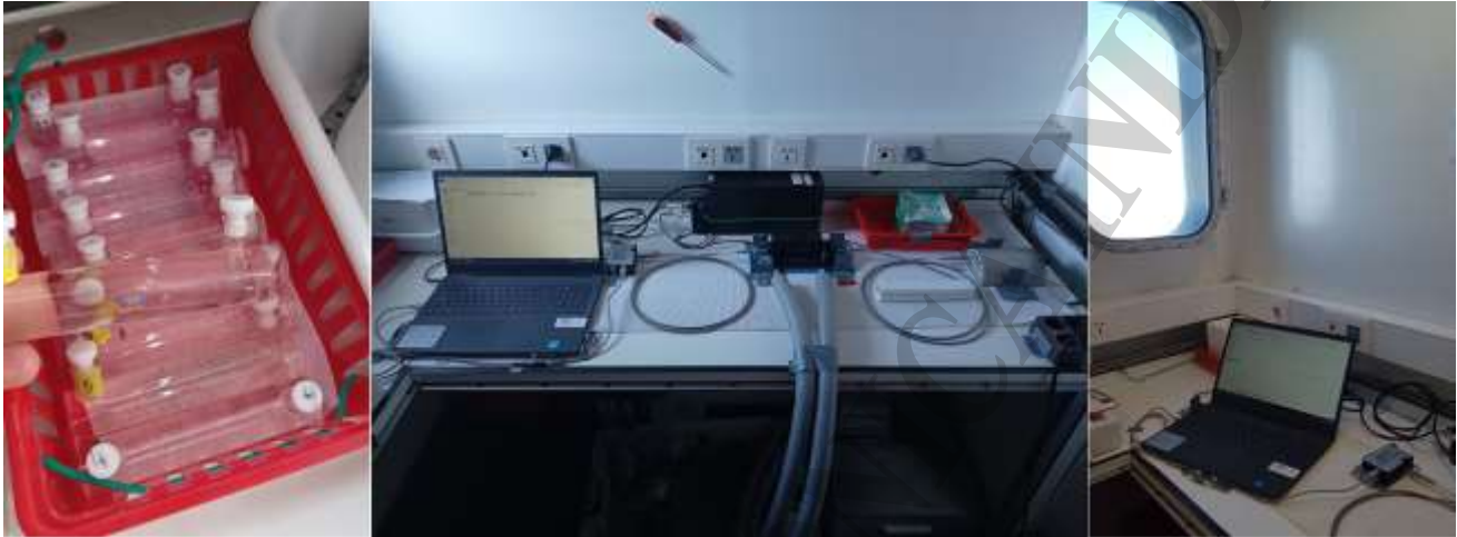
Figura 6. Espectrofotómetro de campo montado en laboratorio multipropósito para la determinación a bordo de pH.

Las muestras de agua de mar para la determinación de la concentración de oxígeno disuelto fueron colectadas en 3 profundidades diferentes (5, 18 y 30 m), directamente de las botellas Niskin en botellas “BOD” de borosilicato de 330 ml y fueron inmediatamente fijadas con 1 ml de sulfato de manganeso y 1 ml de solución alcalina de iodo. Hasta el momento de la determinación, las muestras se preservaron en oscuridad en un cajón de poliestireno expandido a temperatura ambiente de laboratorio. La determinación será realizada en tierra, empleando el método de Winkler tal como lo descrito por Strickland y Parsons (1972).