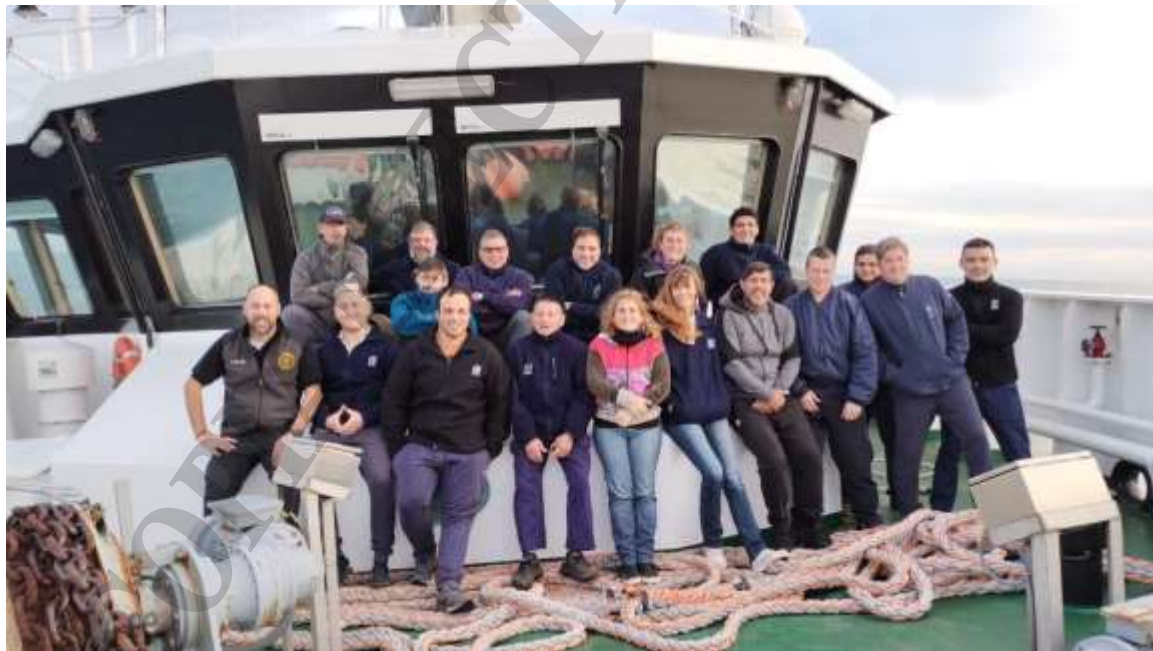
Figura 1. Personal participante de la campaña de investigación MA-2023/10.