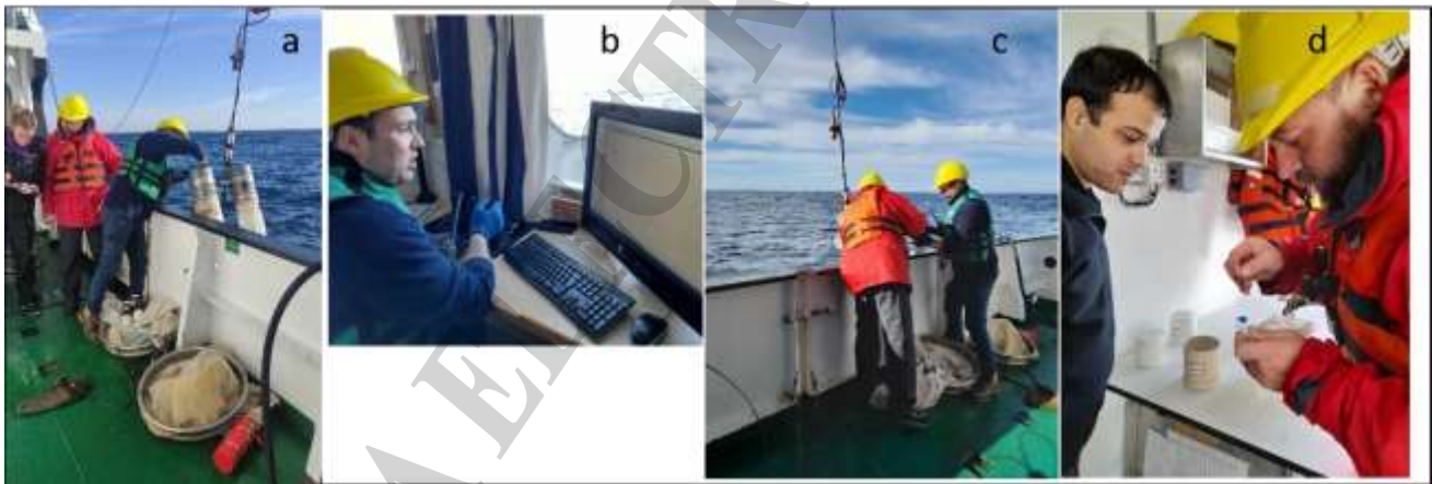
Figura 5. Fotos de: a,b,c) maniobra del uso de las redes Minibongo y Bongo y d) separación de larvas de peces.