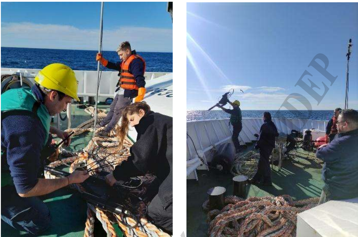
Figura 3. Imágenes de la maniobra del despliegue del radiómetro hiper-espectral.