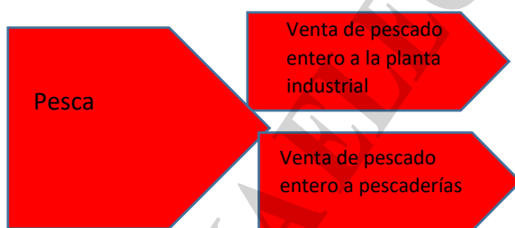
Figura 2: Estrategia de venta a plantas o pescaderías.

incontrolable. Si logra crear sus propias fuentes de suministro habrá transformado su dependencia externa en una cuestión de decisión interna manejable por ella misma.